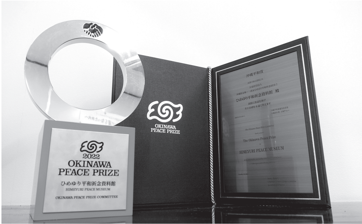
沖縄平和賞の賞状と賞牌