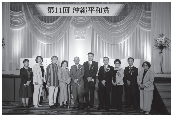
授賞式に出席した当財団の役員と資料館職員

また、元ひめゆり学徒が戦争体験を伝え、平和学習の場として長年平和教育に大きな貢献を果たしてきた実績や、後継者の育成、英語対応の充実による海外発信の活動についてなど当館の具体的な取り組みも評価され、今後の国際平和の推進への貢献と更なる発展への期待も込められたものとなっています。