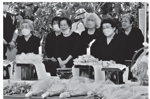
慰霊祭で歌う元ひめゆり学徒

慰霊祭への参加をひかえていただいたご遺族も、お子さんやお孫さんと共に終日参拝に訪れていました。