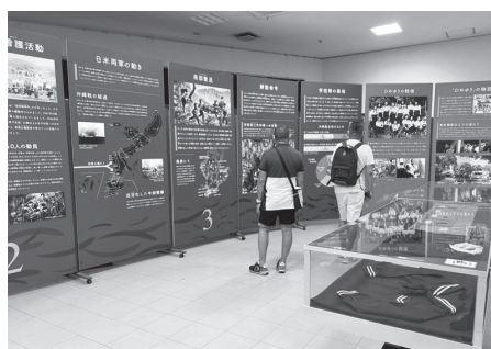
今帰仁村での展示会

なお、ユンタンザミュージアムの開館時間は、午前9時～午後6時(午後5時30分入館締切)、水曜および年末年始(12月28日から翌年1月4日)は休館です。