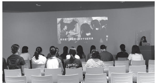
資料館の概要を聞く受講生

は「亡くなった方の写真に性格が書いてあって印象に残った」「同じ年代の子がたくさん死んでいることに驚いた」「この戦争のことを知って伝えないといけない」という感想が聞かれました。