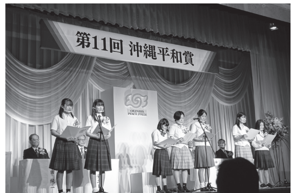
高校生による平和のメッセージ朗読