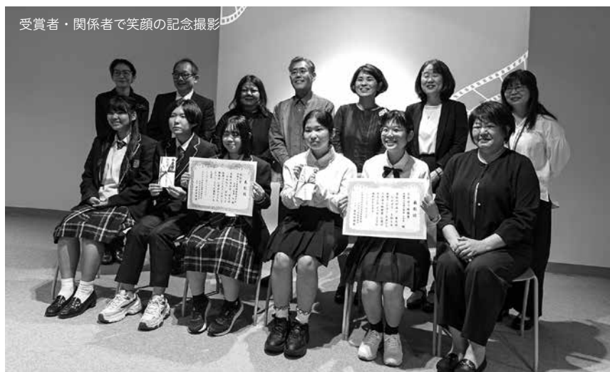
受賞者・関係者で笑顔の記念撮影