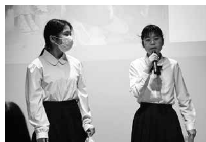
大道小学校6年生児童代表受賞のあいさつ