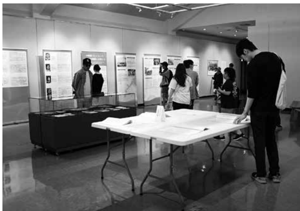
「ひめゆりと八重山」展示会場風景

※本事業は、「令和7年度沖縄文化芸術の創造発信支援事業」の採択事業です。沖縄県、(公財)沖縄県文化芸術振興会の支援を受けて実施しました。