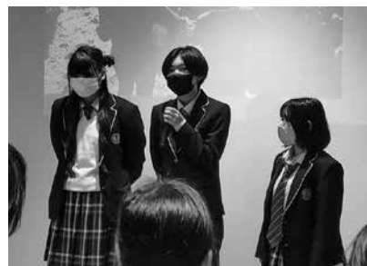
豊見城南高校美術(写真)部のみなさん