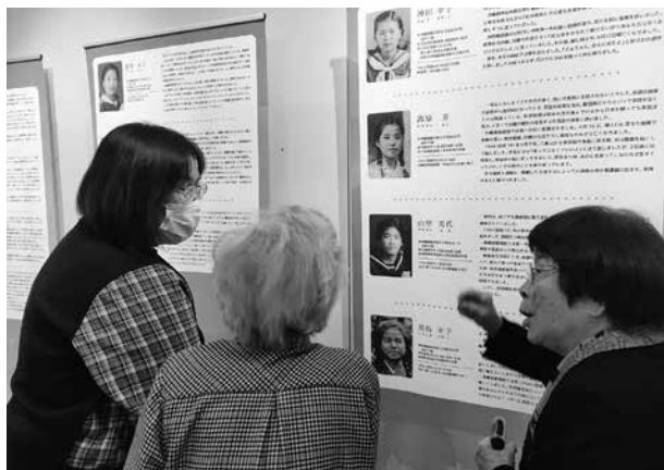
友達のことを話す八重山出身の元ひめゆり学徒